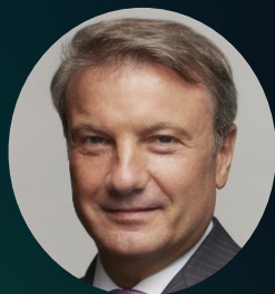
Герман Греф Сопредседатель Комитета, Сбер