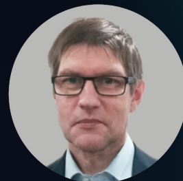
Дмитрий Трещёв Председатель УС Цифровая вселенная, академик РАН