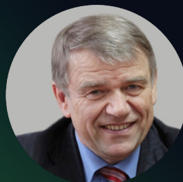
Валентин Пармон Академик РАН