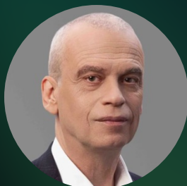
Сергей Лукьянов Лауреат 2024 академик РАН