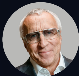
Александр Кулешов Сопредседатель Комитета, академик РАН