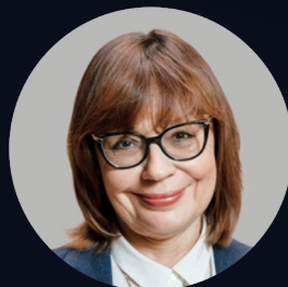
Ольга Донцова Председатель УС Науки о жизни, академик РАН