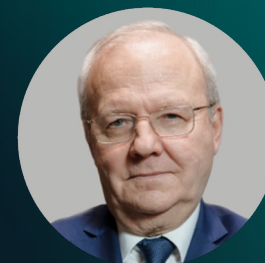
Алексей Хохлов Председатель УС Физический мир, академик РАН