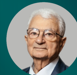
Юрий Оганесян Лауреат 2022 академик РАН